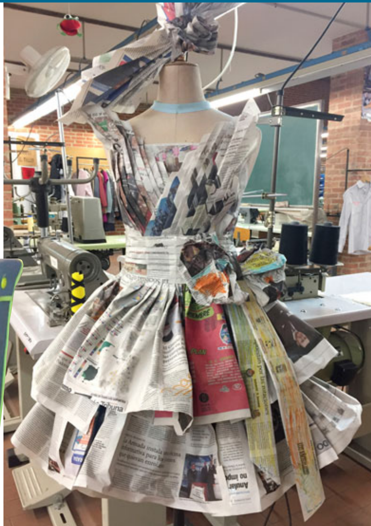
Uno de los diseños realizados por los alumnos con papel de periódico

to y medio plazo muchas salidas laborales. «Si los alumnos quieren seguir formándose se tienen que ir de esta ciudad», apunta Ángela Jiménez, profesora de reparación de calzado y arreglo y adaptación de prendas de vestir.