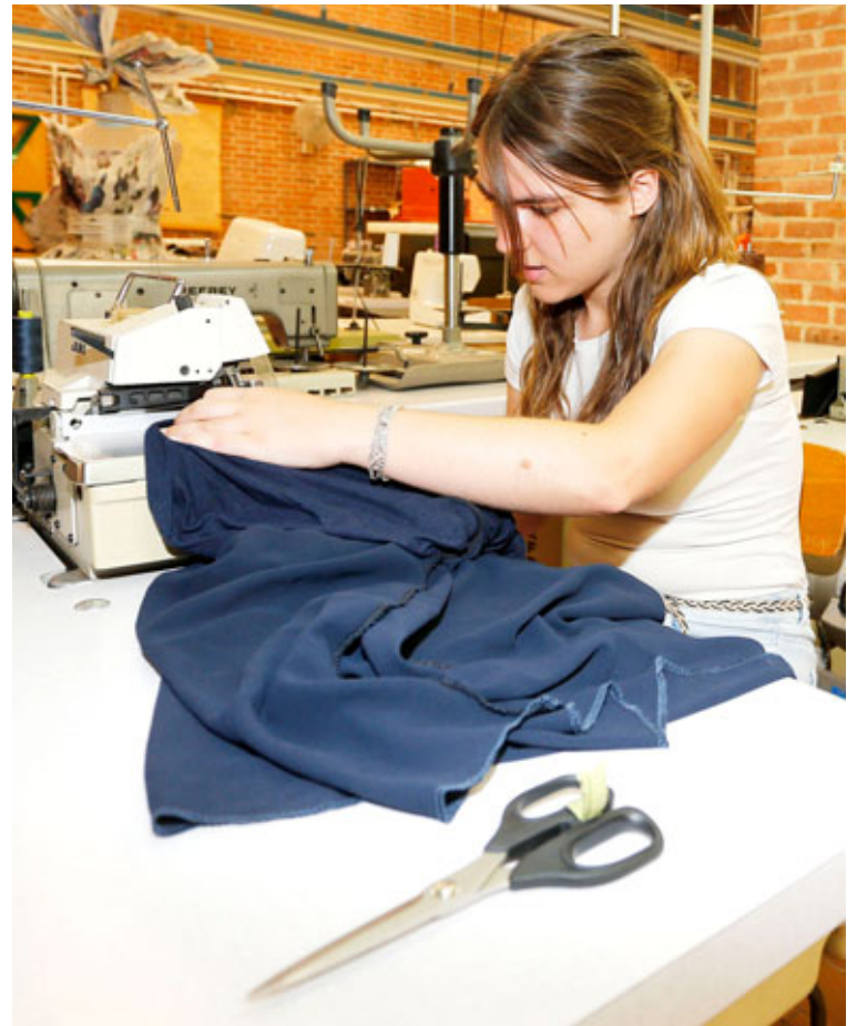
El taller del ciclo de Grado Medio en Confección y Moda se encuentra en el edificio principal del instituto de Secundaria Universidad Laboral. / JOSÉ M. ESPARCIA